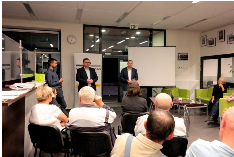
spotkanie w Poraju 16 września 2021 r.